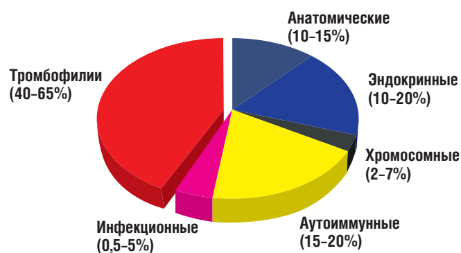
Рис. 2. Тромбофилии в структуре причин репродуктивных потерь [16]

Отдельной проблемой являются тромбозы редких локализаций, которые в 50% случаев возникают спонтанно у пациентов с тромбофилическими состояниями, в остальных случаях, помимо наследственной тромбофилии, в возникновении тромбоза играют роль приобретенные факторы, в первую очередь: беременность, как состояние в норме характеризующееся гиперкоагуляцией [2, 18].